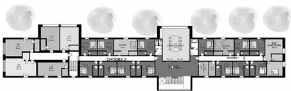
Pôdorys 2. NP