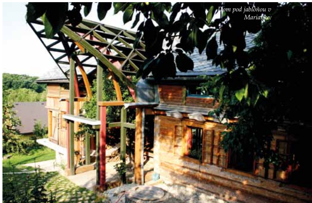
Dom pod jablňou v Marianke.

delenie priestoru na dennú a nočnú časť sme zamenili na detskú a dospelácku časť. (S úsmevom:) Chcel by som ten nápad patentovať - nemá chybu. Prepojili sme oba domy galériou na poschodí, ale naše deti si aj v zime radi skracujú cestu dolným prepojením cez mrazivé átrium. Náš dom nás stále učí nádhernej reči kompromisov, v mene krásy a bez-